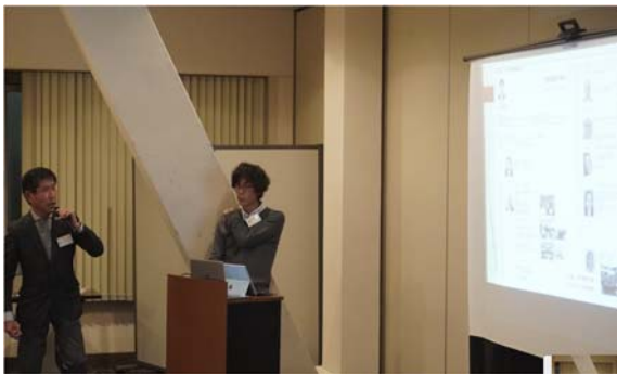
石井氏・安達氏よりJSCA九州支部の活動報告