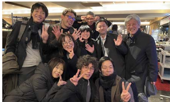
JSCA九州支部の方々とジンギスカン懇親会1