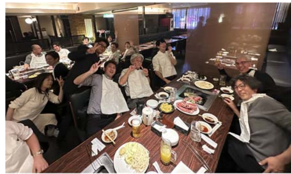
JSCA九州支部の方々とジンギスカン懇親会3