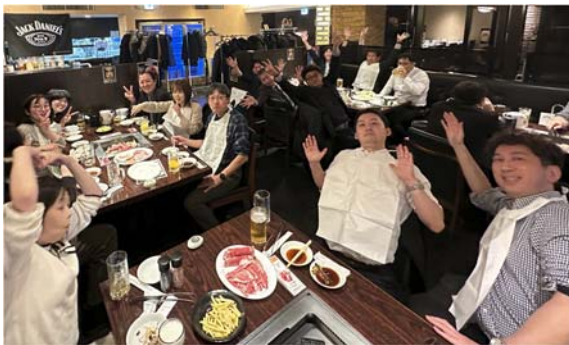
JSCA九州支部の方々とジンギスカン懇親会2