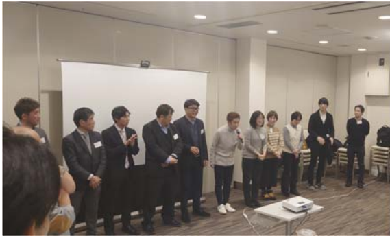
九州支部会員の紹介

北海道らしく、ジンギスカンとビールを飲食しながら、更に交流を深めることができました。