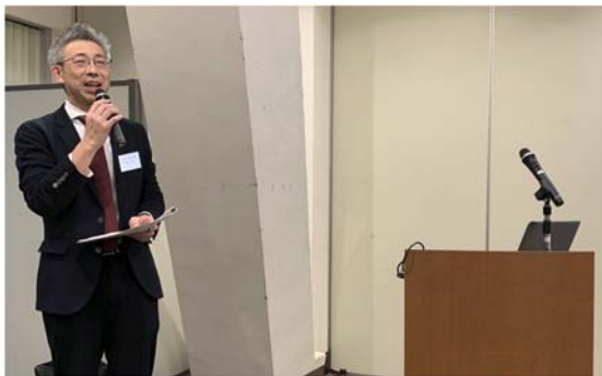
榮前田事業委員長の挨拶

講演は、作品発表・小ネタ紹介何れも大変興味深い内容となり、活発な質疑応答が展開されました。